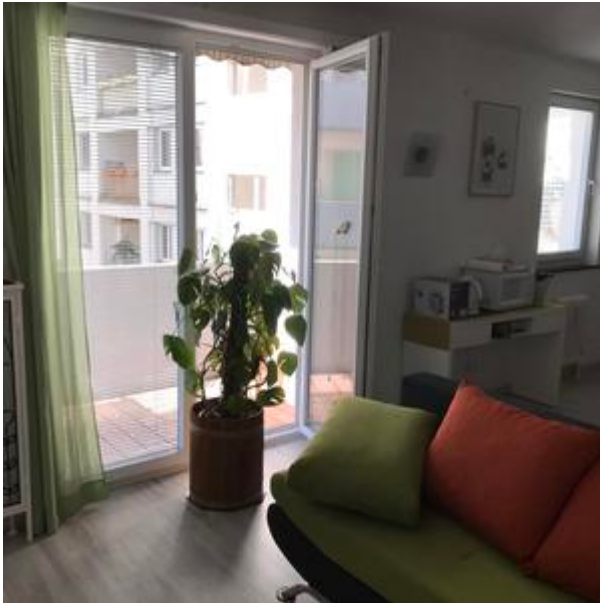
Wohnzimmer mit Zugang auf den 2,5m 2 Balkon