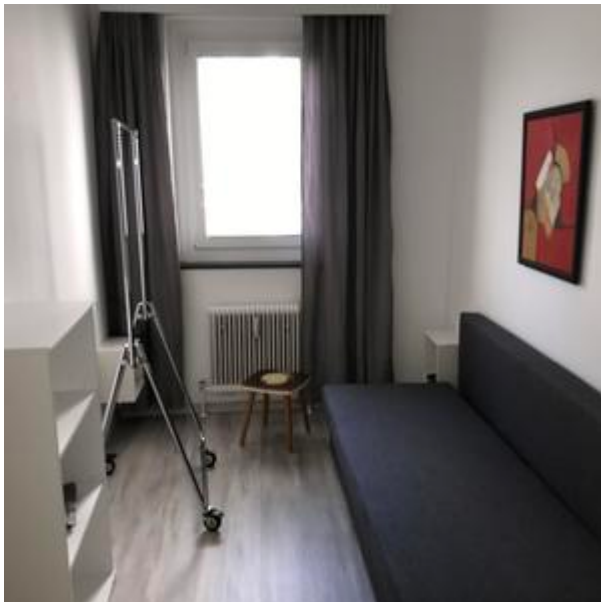
2. Schlafzimmer- Kinderzimmer od.Arbeitszimmer