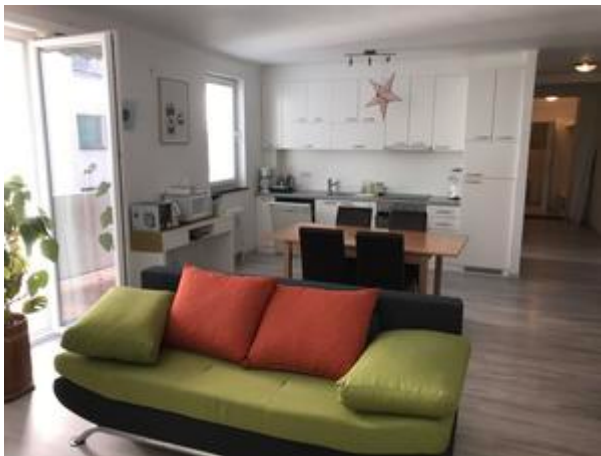
Wohzimmer möbliert mit TV +Sofa + Küche + Sesseln