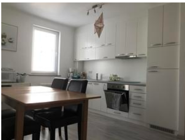
Wohnküche mit Speisegarnitur