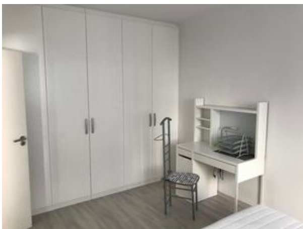
Schlafzimmer mit Kasten