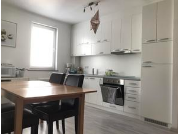
Küche mit E-Geräten und Kochutensilien möbliert