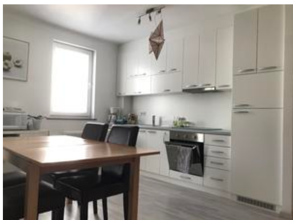
Küche mit E-Geräten und Kochutensilien möbliert